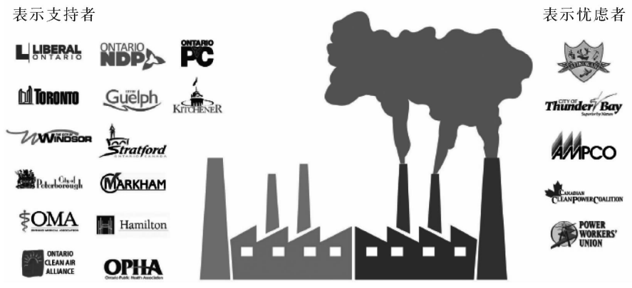
图 2 安大略省煤炭淘汰政策的关键参与者

安大略省电力系统淘汰煤炭的成功是运动发起人、政治家、政府官员们 15 年领导与努力的结果。尽管存在改革的反对者，但其势力并不强大，我们在这份报告中讨论其中的几个原因。图 2 列出了支持和关注安大略省煤炭淘汰政策的关键行动参与者。