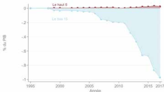
Figure 2 : résultats RDIE nets cumulatifs en pourcentage du PIB

Notes : cette figure montre les résultats nets cumulatifs par rapport au PIB de 2017 pour les cinq pays gagnants (en rouge) et les quinze pays perdants (en bleu).